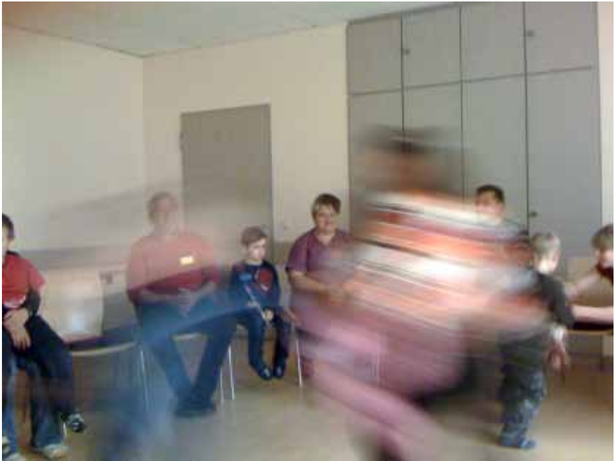
...bei Obstsalat & Klettertour